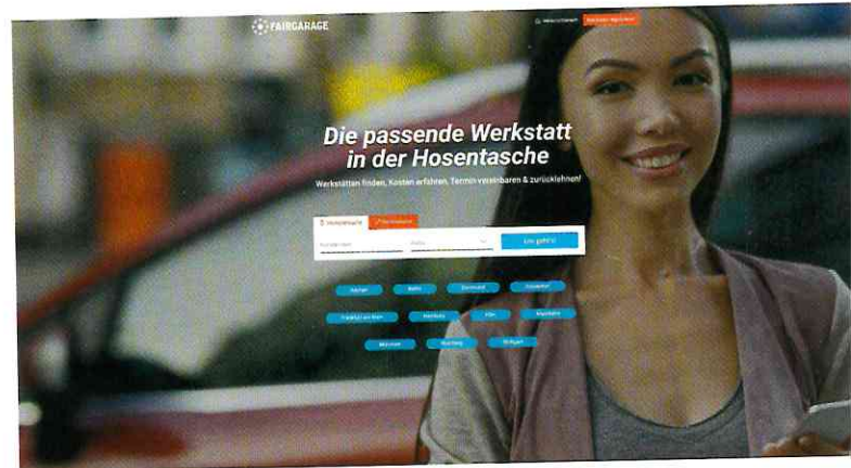
FairGarage ist mit monatlich mehr als 600.000 Besuchern heute die Nummer eins unter den Werkstattportalen und liefert wertvolle Daten für „digital retail“ im Aftersales

betriebes vor Ort liegen und wie digitale Kunden mit welchen konkreten Leistungen im eigenen regionalen Umfeld erreicht werden können, hat Promotor XD zudem aktuell allen voran drei digitale, datenbasierte Dashboards entwickelt: