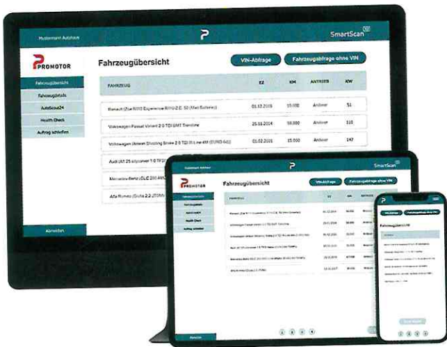
Der SmartScan XD liefert eine professionelle mobile Fahrzeugbewertung auf Basis von DAT-Daten.